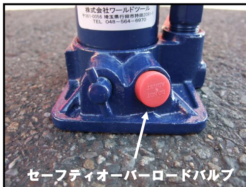
セーフティオーバーロードバルブ

故障の原因となりますので、油圧ポンプのセーフティオーバーロードバルブには絶対に触れないで下さい。このバルブを調整して生じた不具合については保証対象外となりますのでご注意下さい。