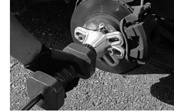
※写真と実際の商品では、形状などが異なります。